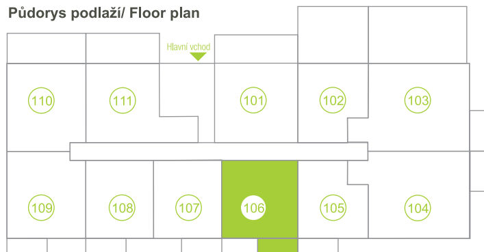
Půdorys podlaží / Floor plan