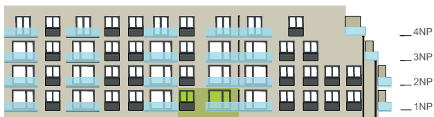
Východní pohled na dům / Building View - east side